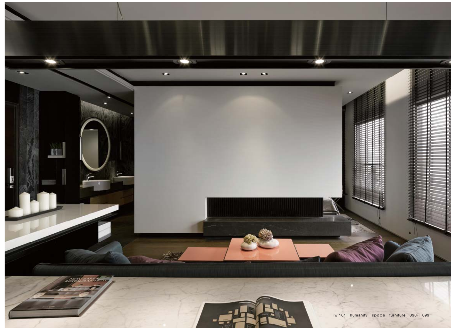
左頁·右頁：白色雙面櫃亦有電視牆功能，製造出數個塊體堆疊的層次感