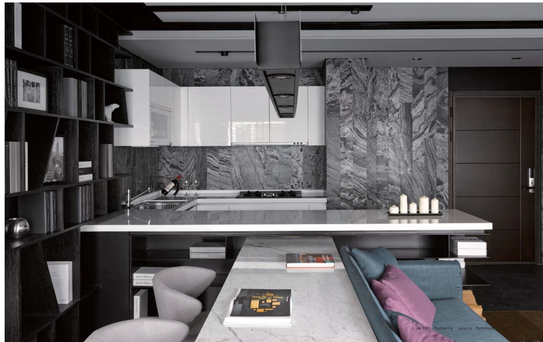
左頁·右頁：利用量體的擺置位置，使不同區域互相扣合，產生視野延伸的效果