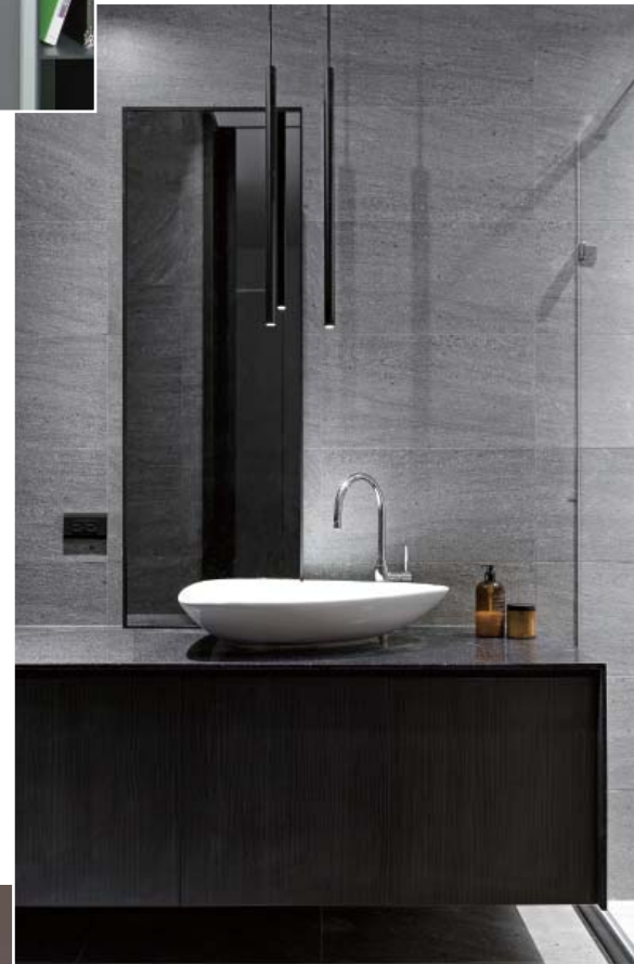
左頁：透過光線與木質元素來柔和無彩度的居家氛圍 右頁：黑白相間的灰色量體，反映出整體色調的漸變與層次