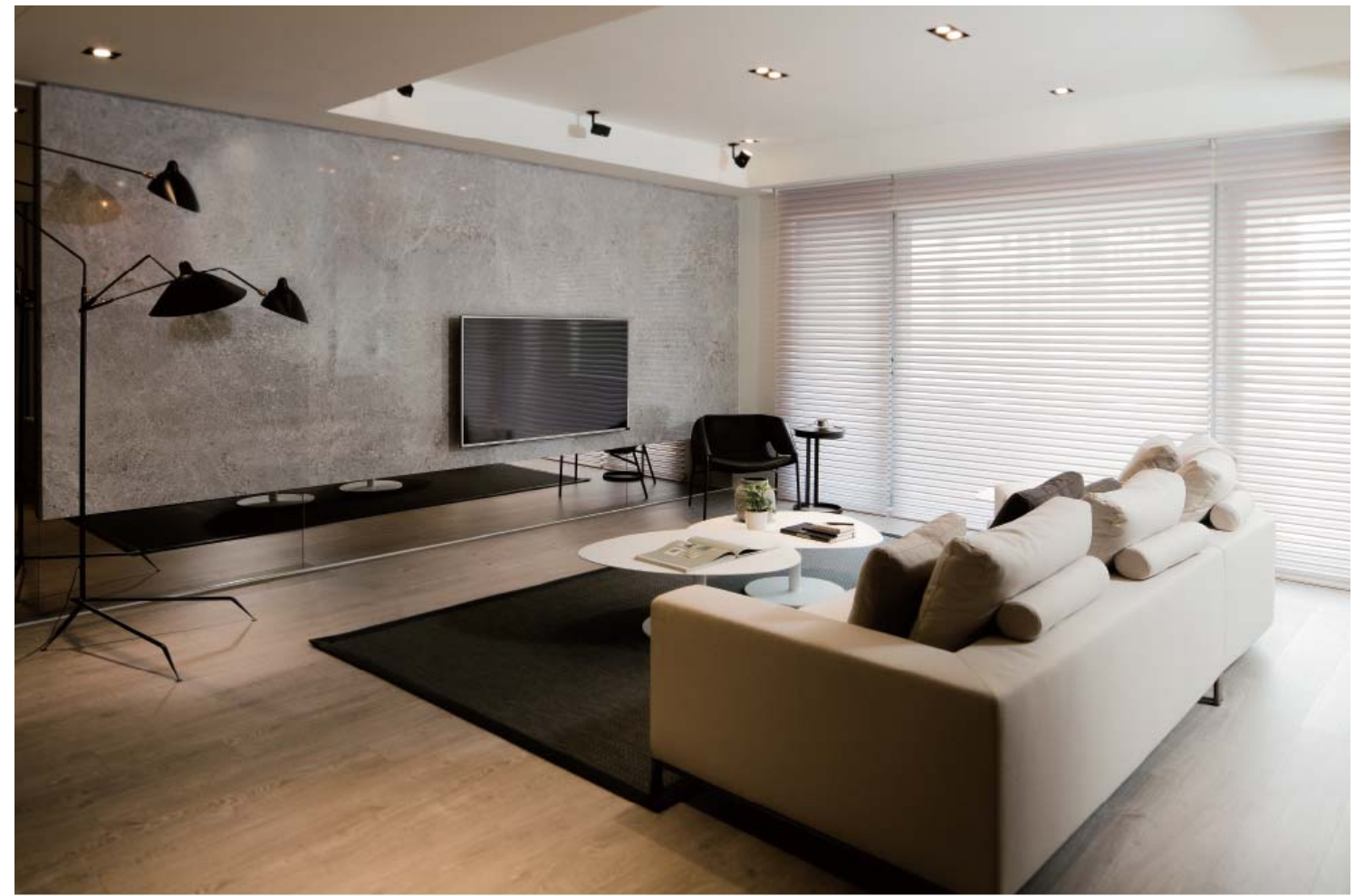
左頁：以穿透的玻璃質材為界定，置身書房可直接透視客廳實際情景