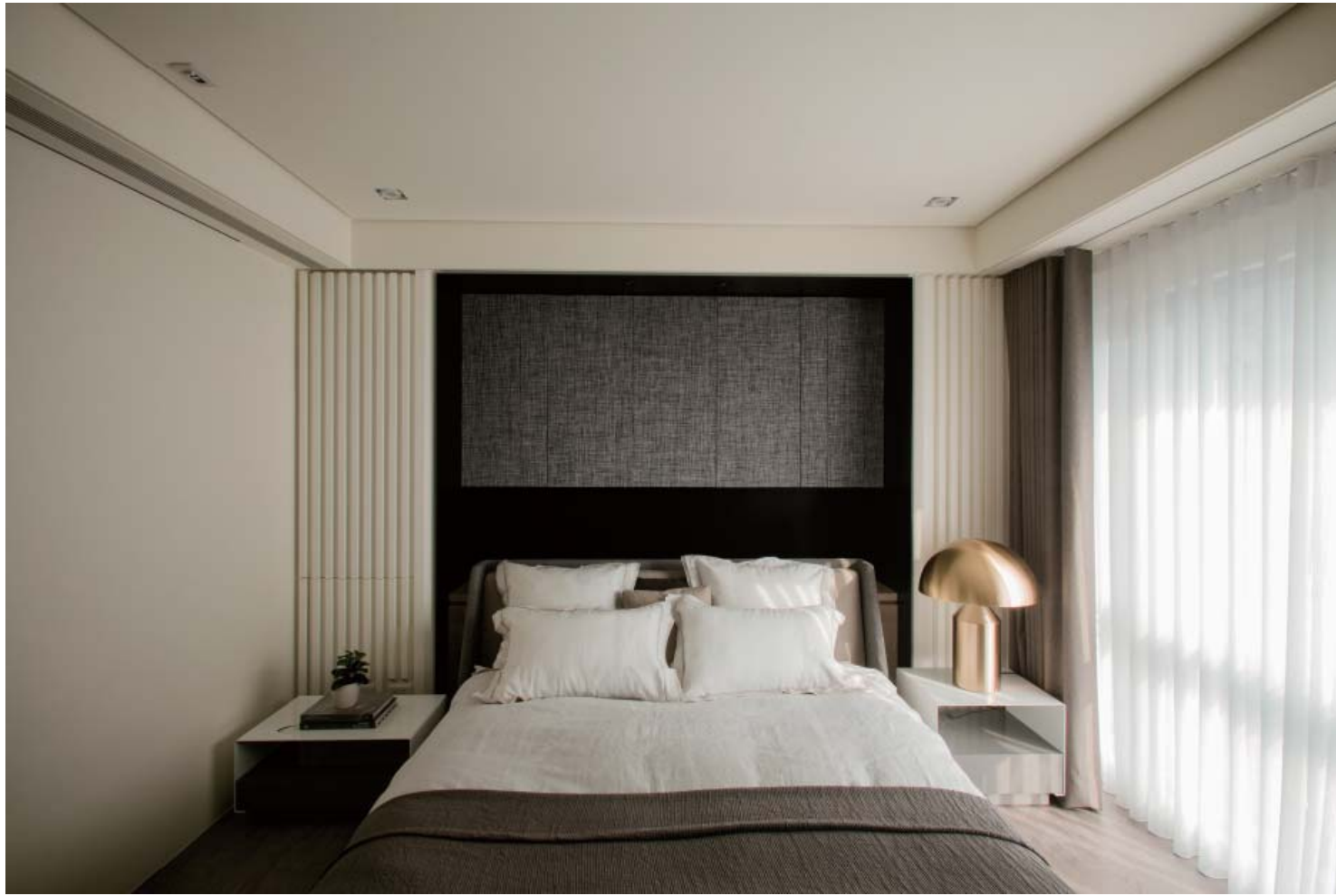
左頁：色調選擇輕盈色系材質，回應業主喜好簡單大方的空間樣貌 右頁：空間回溯建築量體的觀看視角，以面體的延展講究場域間的一體性