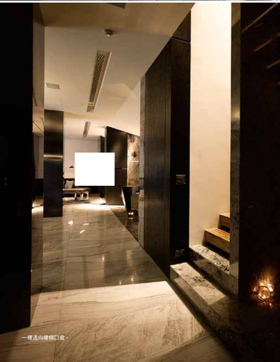
一樓通向樓梯口處。