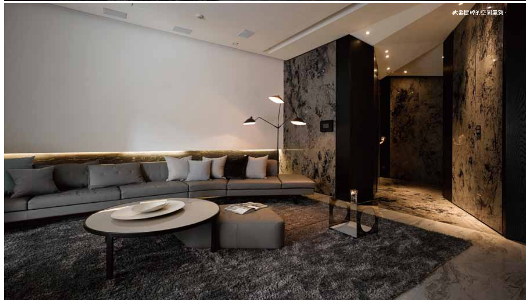
大器闊綽的空間氣勢。