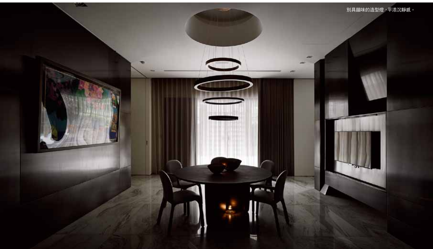
別具韻味的造型燈，平添沉靜感。