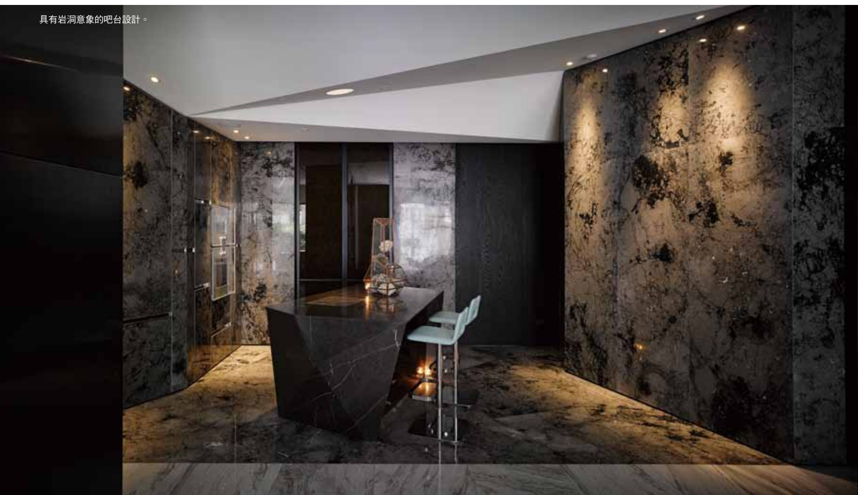
具有岩洞意象的吧台設計。