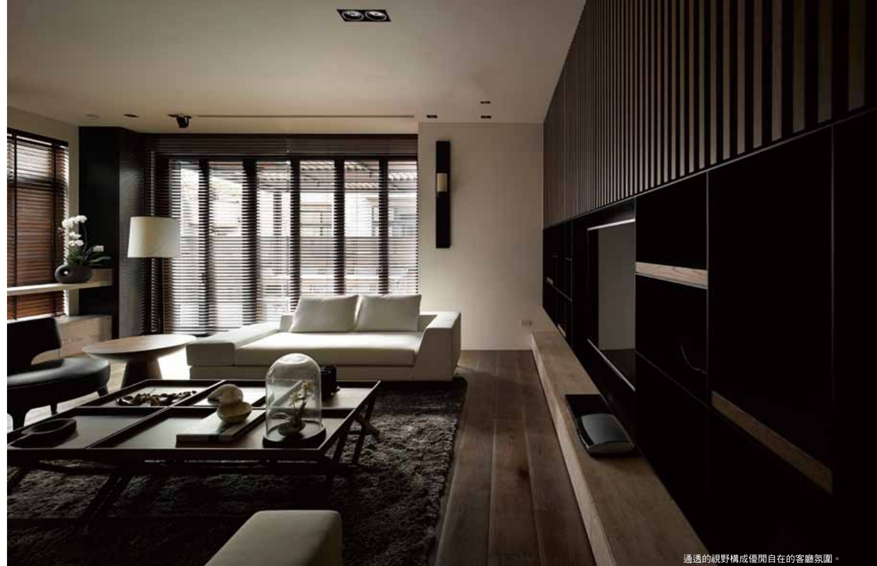
通透的視野構成優閒自在的客廳氛圍。

回歸黑淵靜水自成一格的頂樓主臥，以洗滌為空間破題，黑色的鏡面與地坪板岩倒映出深海無盡的空靈感，貫穿式的流動配置，巧妙的重組衛浴空間機能與獨立體驗。休憩空間則以白色為基底，並將挑高斜屋頂的空間特質轉化為合掌造形天花板，與兩側等份切割的木質造型牆連成一氣，讓建築量體的純粹性展露無疑，純淨的空間感受，也讓心靈得到最自由的紓解。