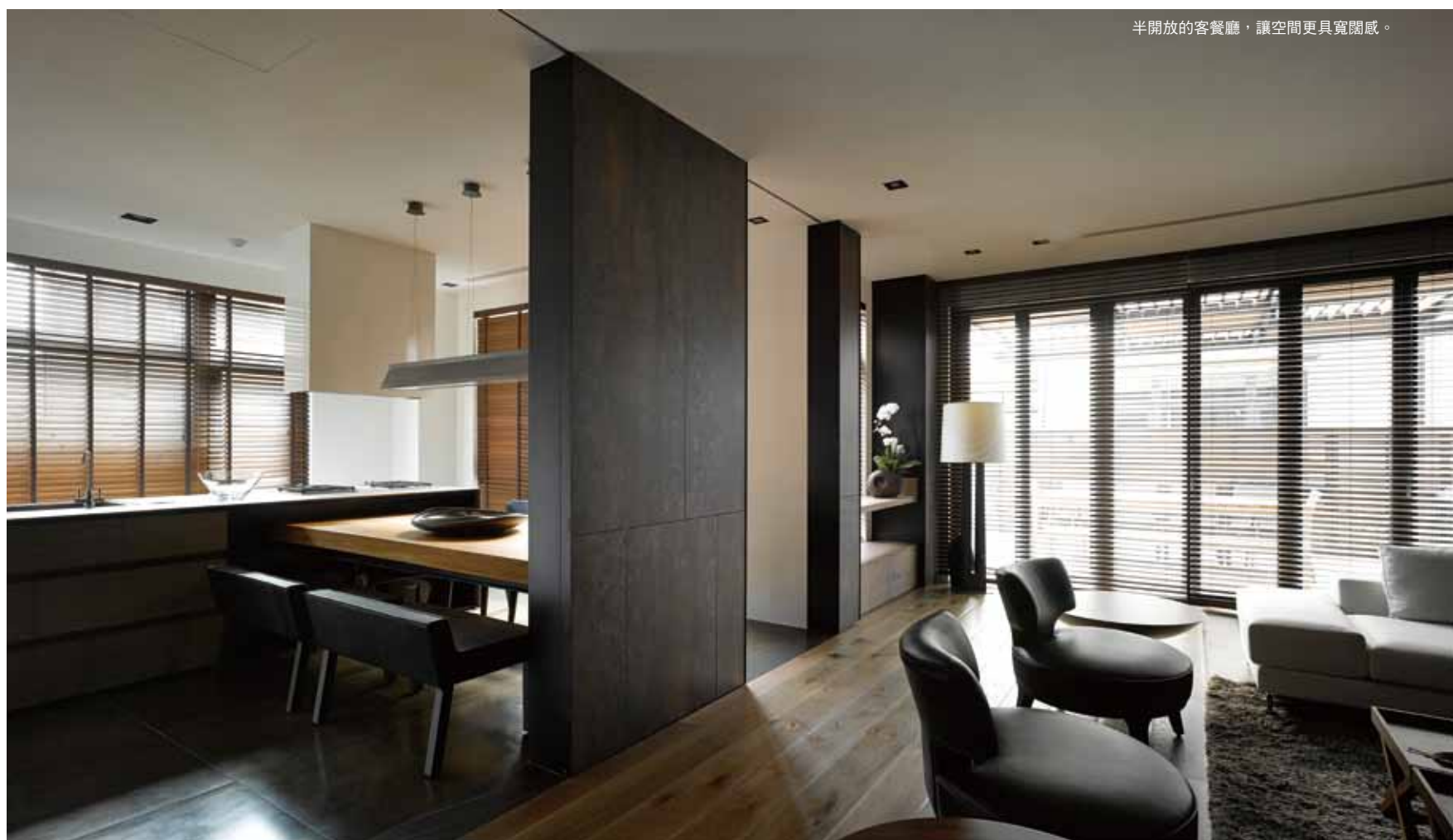
半開放的客餐廳，讓空間更具寬闊感。