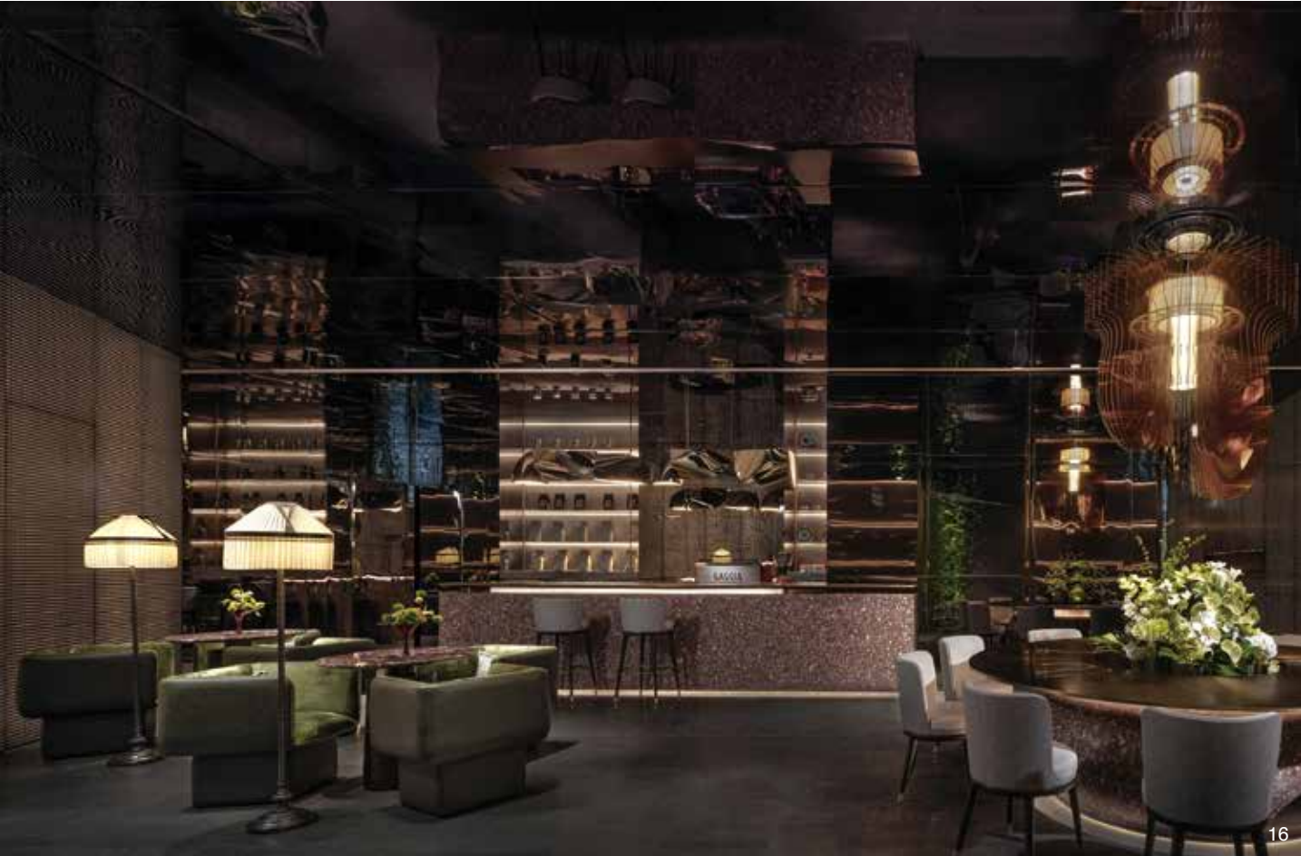
16. 下午茶區的苔蘚綠座椅和桌上的小型插花，和戶外的庭院彼此映襯，將綠意點綴在每個休閒的角落。17. 下午茶區門前的竹林與接待前廳的竹紋暗影，以不同形式加深人文與自然互動的聯繫。18. 穀雨茶室以清新的綠色與竹影，配合枝葉繁茂的造型燈，渲染春天的生機。19. 白露茶室的木質桌椅建構穩定的格局，昏黃燈光暈開秋季的詩意。20. 霜降茶室白淨的整體暗示鋪上一席雪被的天地，深色木質長桌與白色造型燈，反襯出沉靜的冬季。21. 私宴雪茄區巨大的黃銅吊燈、皮革沙發，與黑白照片，營造一處充滿懷舊風味的舞台情境。22. 健身房的牆面通過竹林和石材的運用，呈現出宛如在戶外運動的效果。