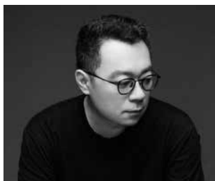
近境制作 / 唐忠漢

1. 環繞中央庭院部署的格局，結合室內外特色打造獨特景觀。2. 旋轉樓梯給予動線儀式感，呈現雕塑般的造型。